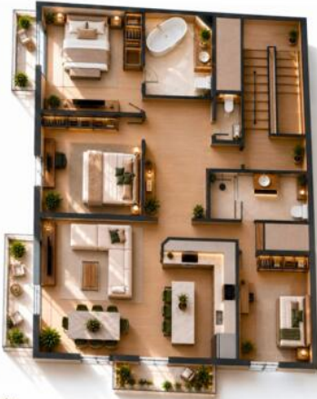
Design Vision for a Future Renovation

Тел : +377 99 90 61 51 contact@astralproperties.mc www.astralproperties.mc