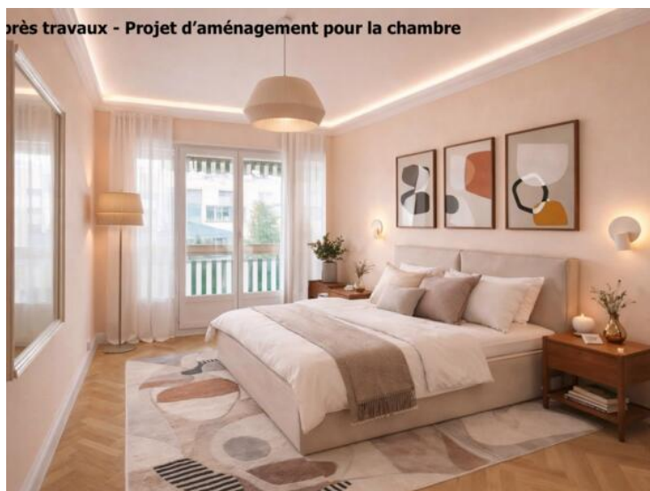
Après travaux - Projet d'aménagement pour la chambre