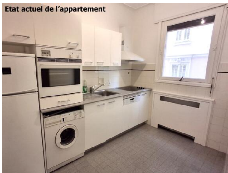
Etat actuel de l'appartement