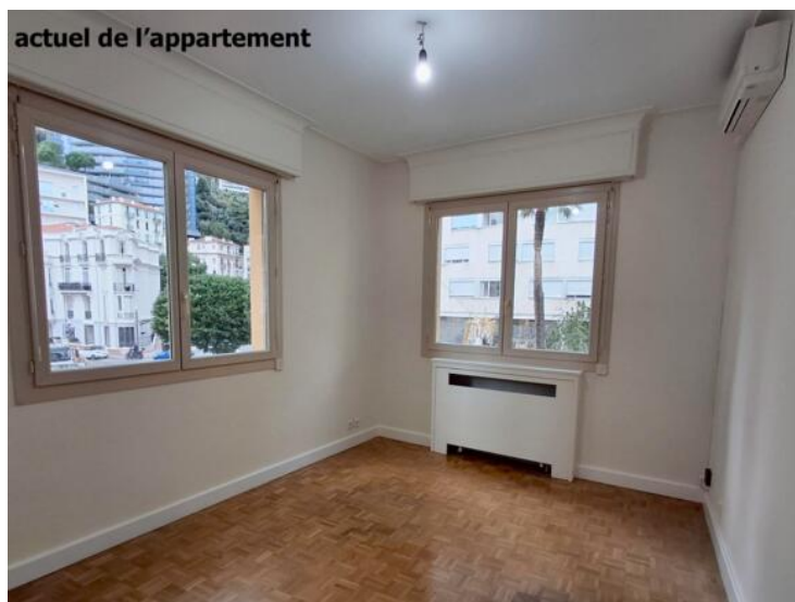
actuel de l'appartement