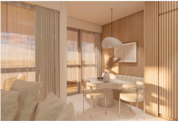
CUISINE + SA MANGER