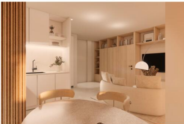
CUISINE + SA MANGER