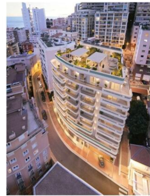
Plans, images, textes et surfaces non contractuels.