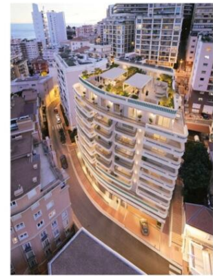
Plans, images, textes et surfaces non contractuels.