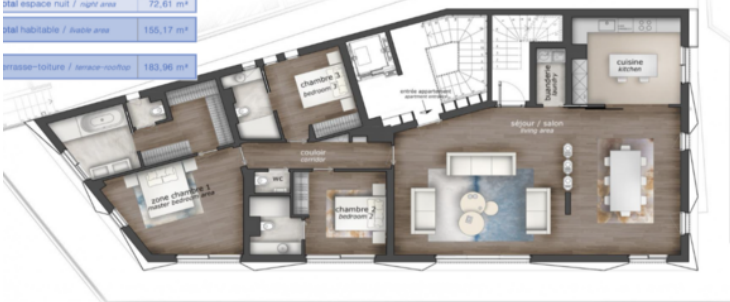
Toit-terrasse privatif appartement R+2 = 183,96 m 2 private rooftop apartment R+2