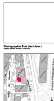
PC02_SITU - Plan de situation