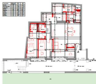
PC07_NV_R+1 - Plan État Projeté Scale: 1/50