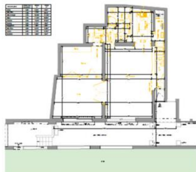
PC07_NV_R+1 - Plan État des Lieux / Démolition Scale: 1/50