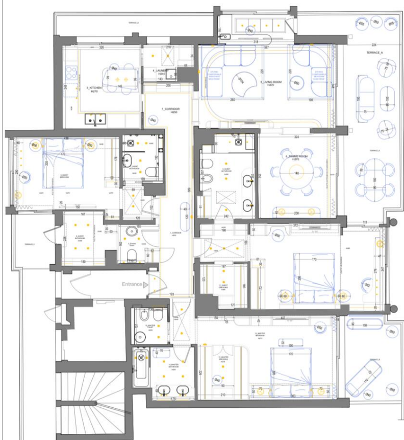
RIVIERA - Layout Definitivo - ARREDI QUOTATI