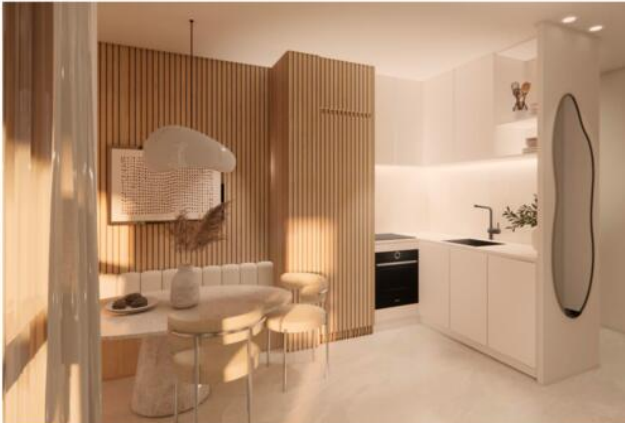
CUISINE + S MANGER