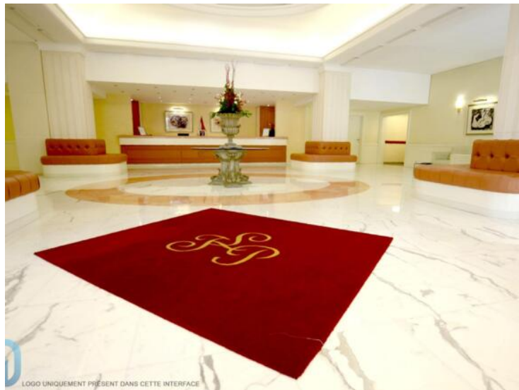
LOGO UNIQUEMENT PRÉSENT DANS CETTE INTERFACE