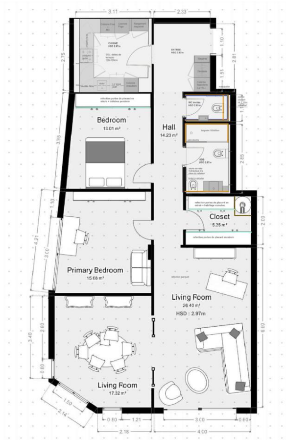
LE SANTA MONICA - Plan

Emma Ruspantini Tél : +377 6 40 61 13 70/+377 93 50 54 64 emma@continentale.mc www.continentale.mc