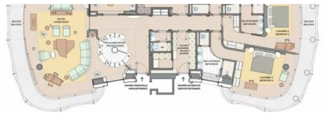
Master bedroom floor :