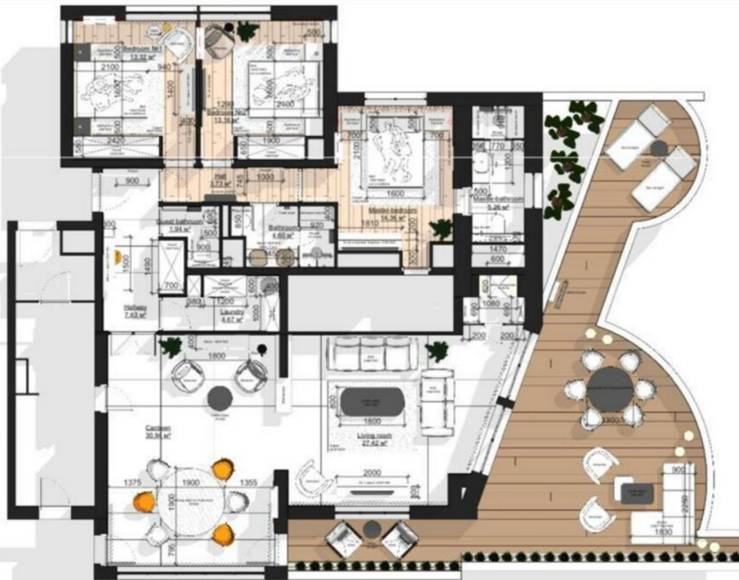
Plannina decision with dimensions