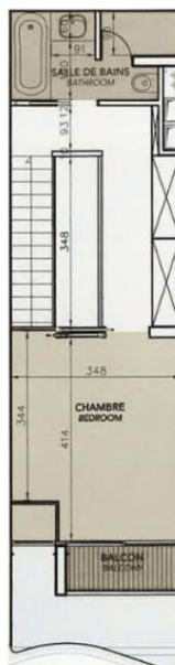
8ème étage / 8th floor