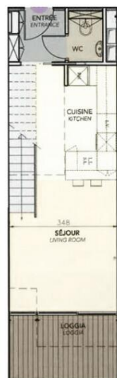
7ème étage / 7th floor