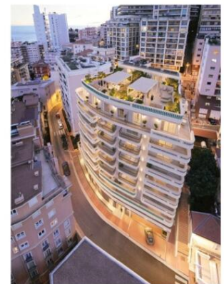
Plans, images, textes et surfaces non contractuels.