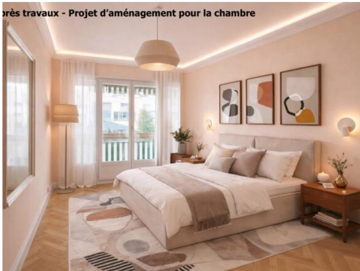
Après travaux - Projet d'aménagement pour la chambre