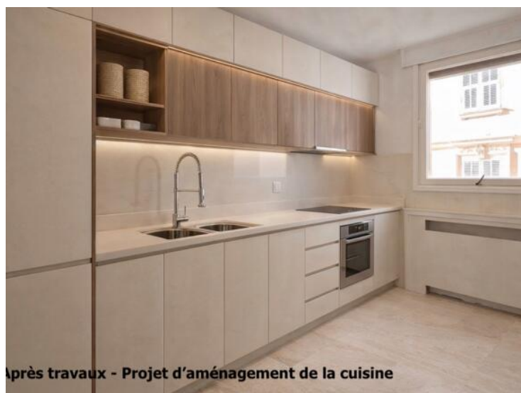
Après travaux - Projet d'aménagement de la cuisine