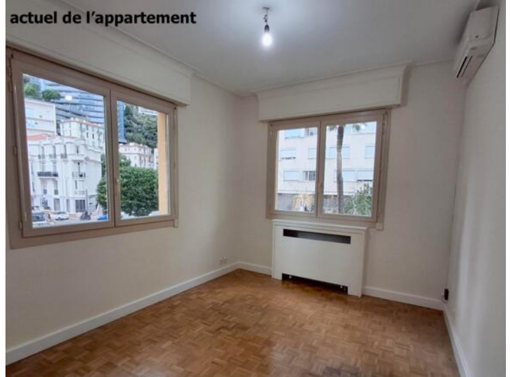
actuel de l'appartement