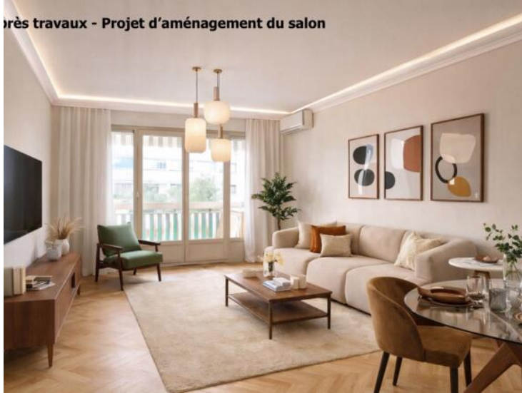
Après travaux - Projet d'aménagement du salon