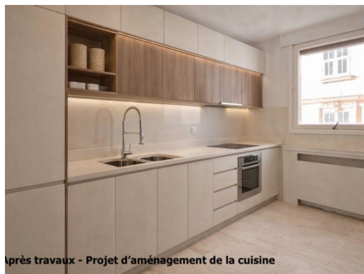
Après travaux - Projet d'aménagement de la cuisine