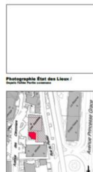
PC02_SITU - Plan de situation